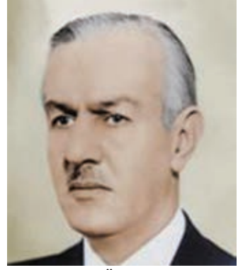
193. S. Hayri Ürgüplü