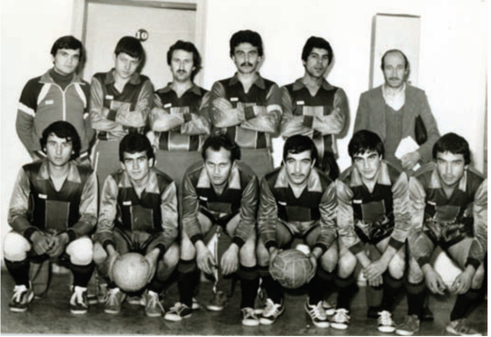
191. Erkmenspor Voleybol Takımı

cadele sergilemiş ve grubunu Şuhut Hisarspor ile aynı puanı toplayarak ilk iki sırada bitirmiştir. Grup birincisinin belirlenmesi amacıyla yapılan baraj maçlarının ilki 1-1, ikincisi ise 2-2 beraberlikle sonuçlanınca seri penaltı atışlarına geçilmiş ve penaltı atışlarının 7-6 kaybeden Erkmenspor, grup birinciliğini ve dolayısıyla I. Amatör Lig'e yükselme şansını da rakibi Şuhut Hisar Spor'a kaptırmıştır. 6 Erkmenspor, 1985-1986 sezonunda büyük erkekler voleybol ligi ile Genç Erkekler Basketbol ligini de üçüncü sırada bitirmiştir.