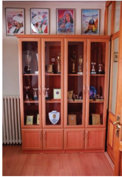
189. Erkmenspor Müzesi