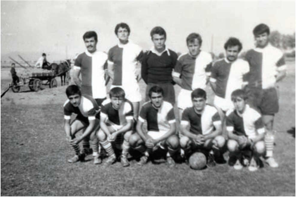
188. Erkmenspor'un ilk futbol takımı, 1974.