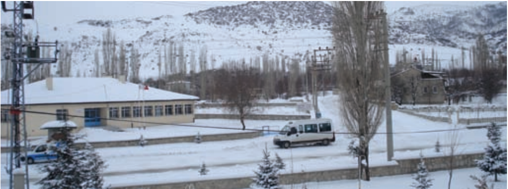
187. Erkmen Sağlık Ocağı