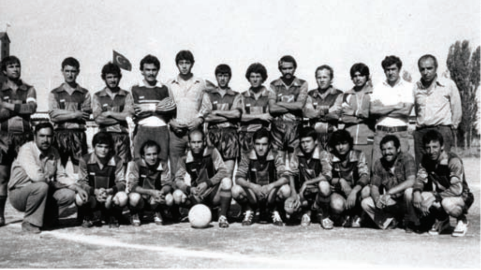
190. Erkmenspor Futbol Takımı