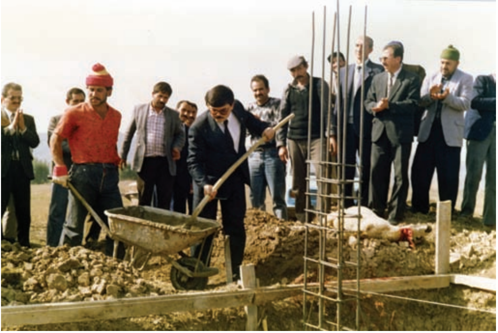
186. Bin tonluk soğuk hava deposu temel atma töreni

Köyde ihtiyaç durumuna gelmesi üzerine Kooperatif tarafından bugünkü vişne alım merkezinin bulunduğu yere 1980 yılında bir hızar atölyesi kurulmuştur. Atölye halen masraf karşılığı kasaba halkına hizmet vermeye devam etmektedir.