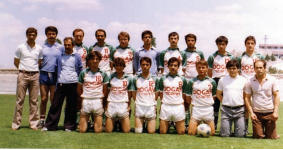
192. Erkmenspor Futbol Takımı

kadrosu ile 73 gol yiyerek grubunun en çok gol yiyen takımı olmuştur. 8 1989-1990 sezonunda I. Amatör Lig A grubu'nda yer alan Erkmenspor, maddi olanaksızlıklar yüzünden sezon başında ligden çekilince 9 , II. Amatör Futbol Ligi'ne düşmüştür. 10