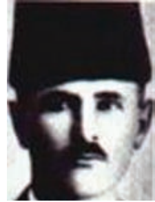
68. Yarbay Ömer Lütfi

"-1919 senesi Şubat ayının dördüncü günü, 23. Tümen Kumandanı olarak Afyonkarahisar'ına, (o günkü ismi Karahisar-ı Sahib) gelmiştim. Burada, I. Dünya Harbi içinde esir ettiğimiz düşman kuvvetleri mensupları içinde rütbesi yüzbaşı ve üstünlere mahsus bir üserâ karargahı vardı. Bu sebeple mütareke ilan edilir edilmez, İngiliz ve Fransızlar buraya mümessiller göndermişlerdi. Aynı zamanda bir Kızılhaç Heyeti de bulunuyordu. Afyon'un stratejik vaziyeti dolayısıyla gelenler çıkmak istemediler.