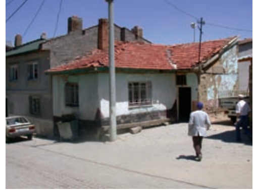
71. Arapların oda