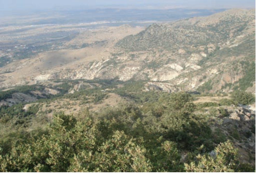
73. Yakın planda Erkmen Tepeleri, arka planda Hisarlık Tepesi